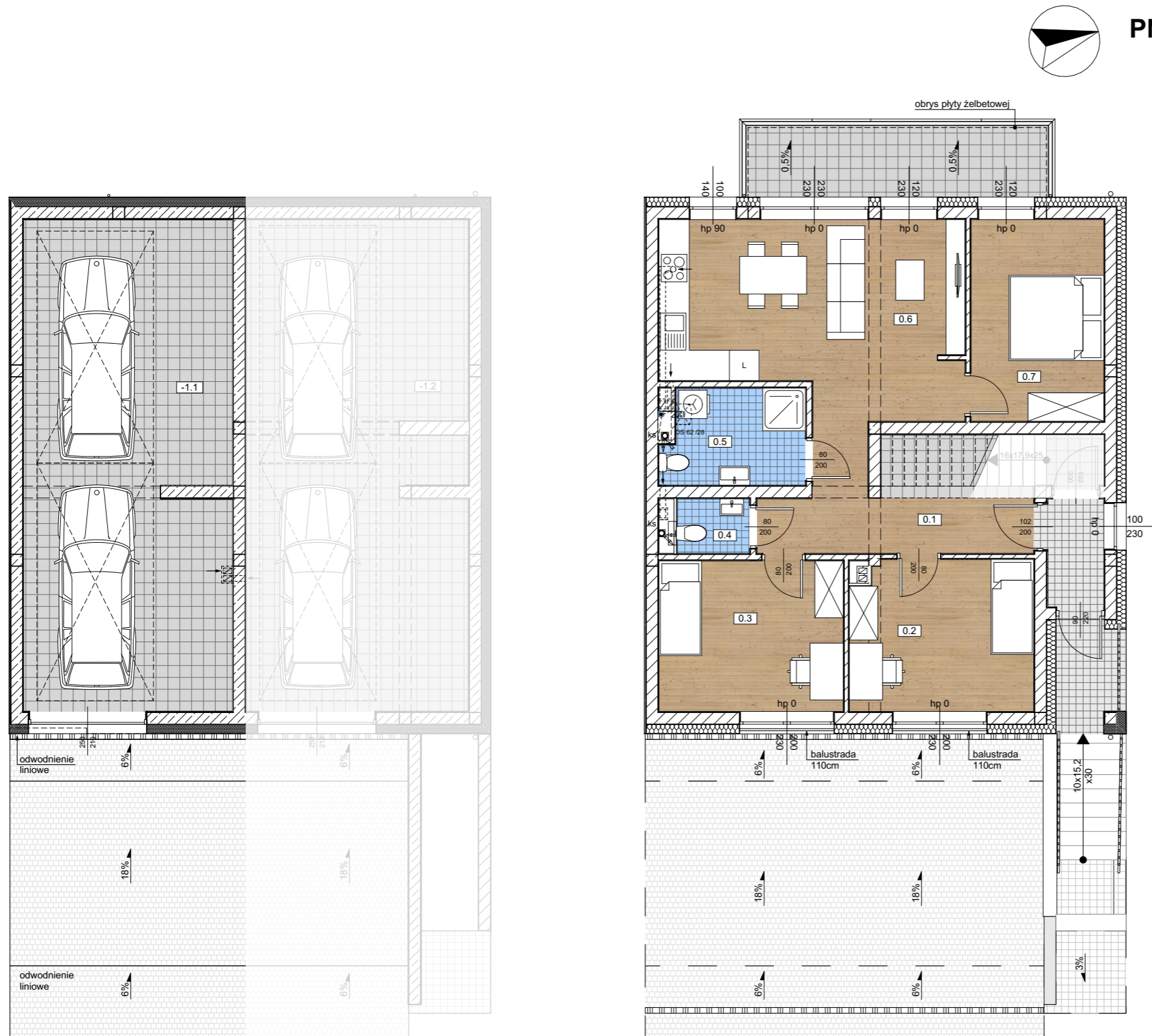
Rzut garażu indywidualnego -1