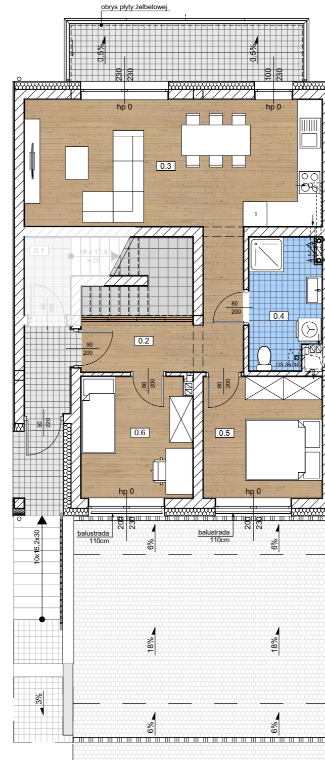
Rzut parteru 0